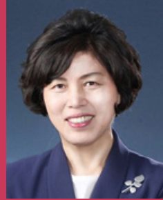
숙명여자대학교 총장 강정애