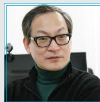
위키트리 공훈의 대표