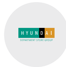
현대백화점 마케팅 임원