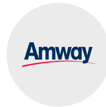
한국암웨이 마케팅 임원