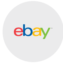
이베이코리아 마케팅 임원