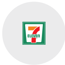
코리아세븐 마케팅 임원