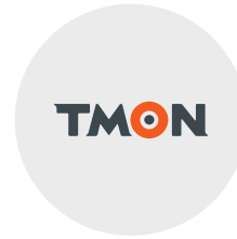
티켓몬스터 마케팅 임원