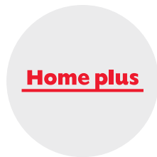
홈플러스 마케팅 임원