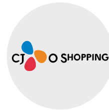
CJ 오쇼핑 마케팅 임원