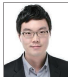
카이스트 박 성 혁 교수