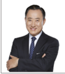
코웨이 이해선 대표