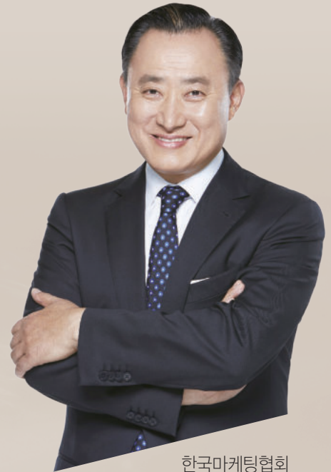
한국마케팅협회 회장 이 해 선

바쁜 경영자를 위해 조찬 형식으로 진행되는 강의와 다양한 특별 강연으로 이루어지는 본 과정을 통해 귀사의 마케팅 경쟁력이 한 단계 업그레이드 될 수 있기를 기원합니다.